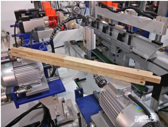
(图 1 picture 1)