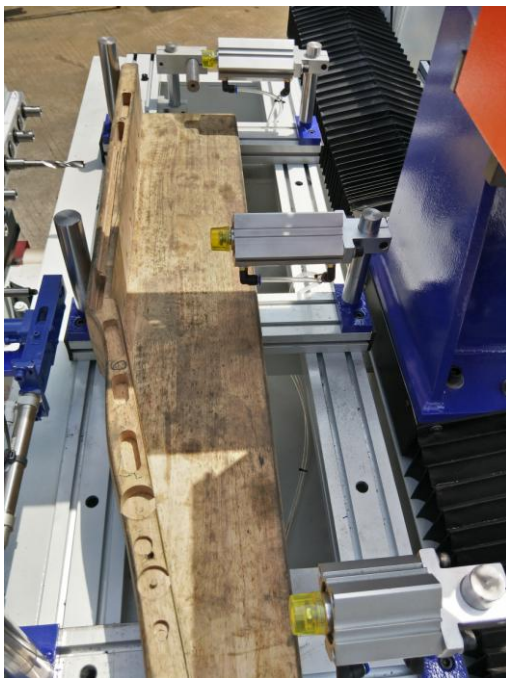
(图 1 Picture 1 实木床桩样条特写)