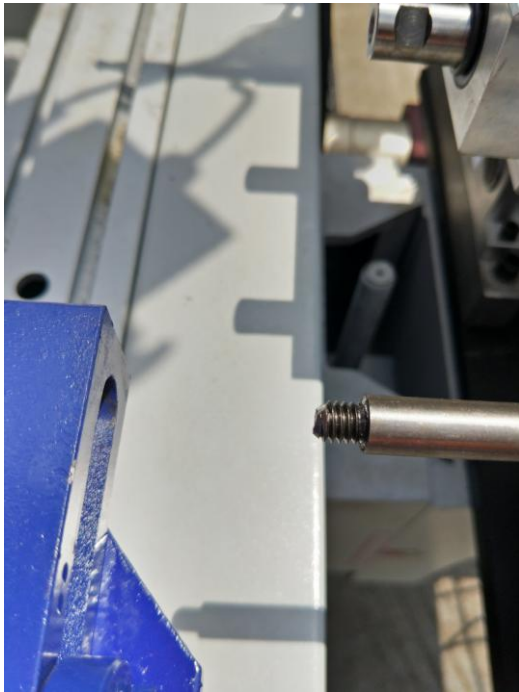
( 图 3 Picture 3 )