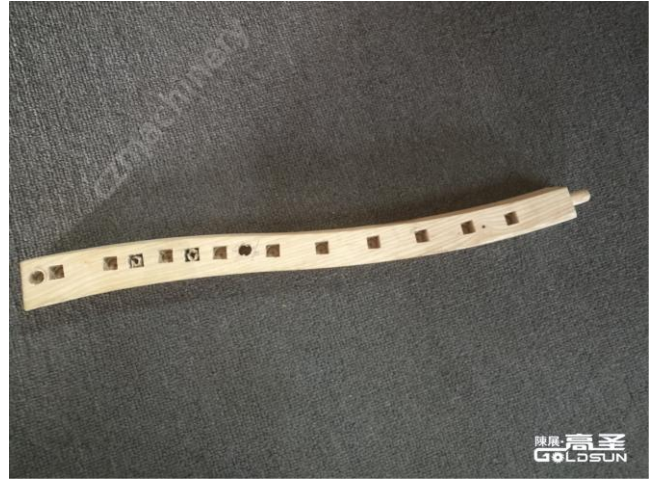
(图 2 Picture2)