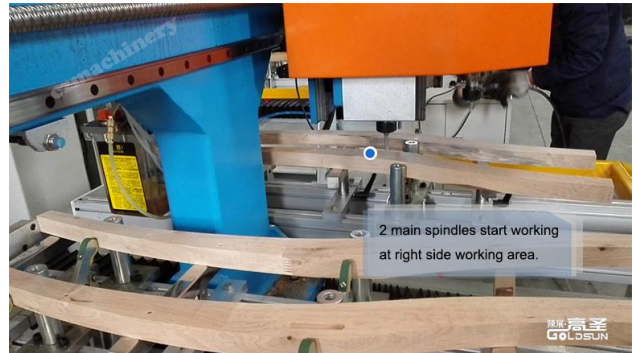
(主轴切换到右边区域的加工) (The spindle switches to the right area for processing) (Trục chính chuyển sang khu vực bên phải của gia công)