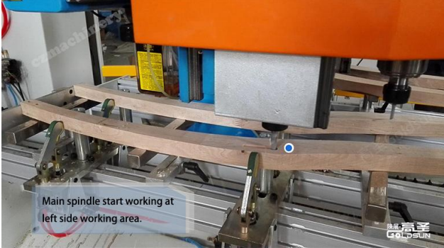
(主轴的铣槽动作) (The spindle milling groove) ( Xử lý trục chính )