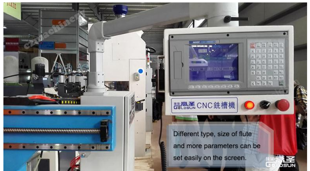
(可在屏幕上设置不同形状、尺寸的槽、扩孔、圆弧等) (The screen can be set with different shapes, sizes of slots, reaming, arc and so on) (Có thể được đặt trên màn hình hình dạng khác nhau, kích cỡ của khe, reaming, cung và v)