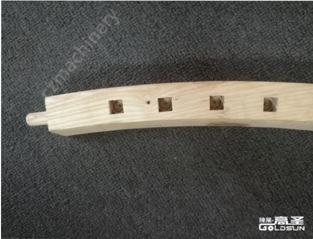
(图 1 Picture1)