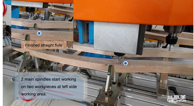
(主轴在左边区域的加工) (The spindle is processed in the left area) (Trục chính được gia công ở khu vực bên trái)