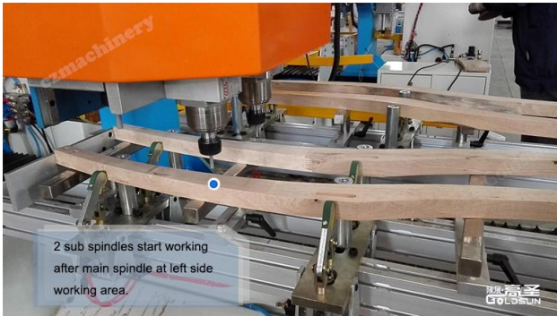
(副轴开始钻孔) (The secondary axis starts drilling) (Trục phụ bắt đầu khoan)